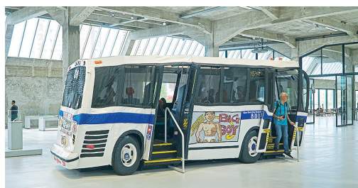
布製巴士 Red Grooms的The Bus（1995）是開幕藝術展焦點作品，觀眾能走入布製巴士，感受美國文化熔爐紐約的巴士體驗。