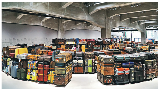
行李迷宮 館內常設的展品Suitcase Labyrinth，將收集得來的約2000個行李箱排成迷宮，觀眾能透過錄音導賞細聽每個行李箱的故事。