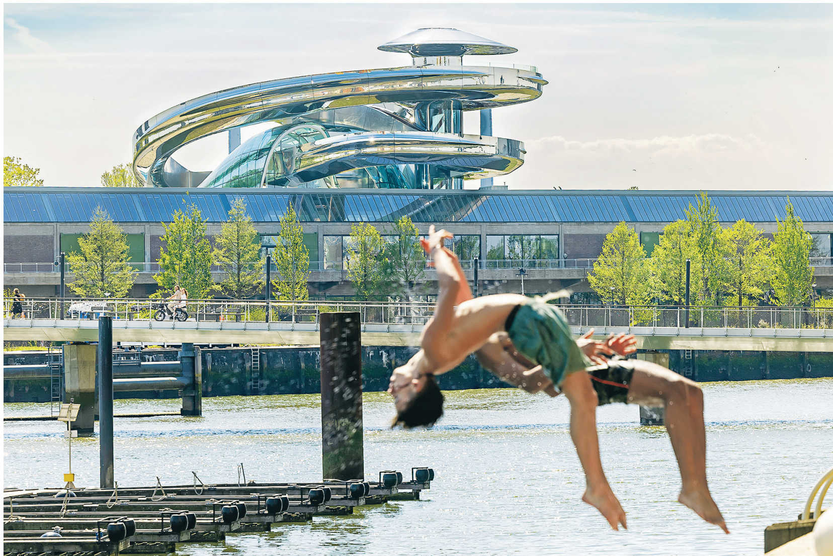
新港口熱點 開放港口成不少旅遊城市的發展方向，如新開幕的FENIX所在地區Rijnhaven，便設有港口泳池和即將落成的荷蘭相片博物館。FENIX移民博物館內的雙螺旋觀景樓梯Tornado，能360度俯瞰港口，即使需要購買門票，亦值得到此一遊。

荷蘭鹿特丹或者不是大家心目中的一線旅遊城市，沒有歐洲城市一貫的「歷史感」，也並非以自然景觀掛帥的度假勝地。鹿特丹在二次大戰期間被德軍無情轟炸，很多歷史建築均被炸毀，但在都市重建計劃時卻建起了很多極具設計感的建築物。最近當地開設了兩個跟其港口背景相關的新景點，其螺旋觀景樓梯和層疊貨櫃箱的外形打卡一流，也讓人深入了解這個港口城市的過去、現在與未來。