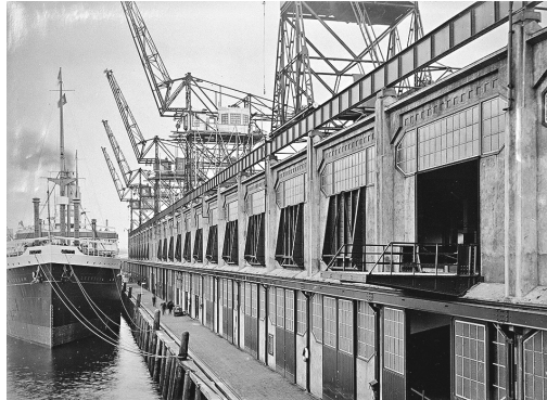
館址前身 FENIX 前身為 San Francisco Warehouse（圖），活化後仍保留原有工業風格。長約360米的FENIX設有公眾空間Plein，在室內廣場舉辦活動。（Rotterdam City Archives提供）